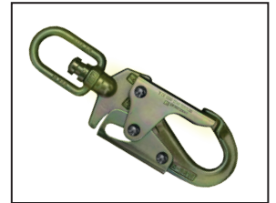
IKV 33 (ANSI Z.359.1-2007; CSA Z259.12-2011) mit Fallanzeiger